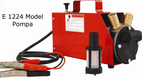
E 1224 Model Pompa