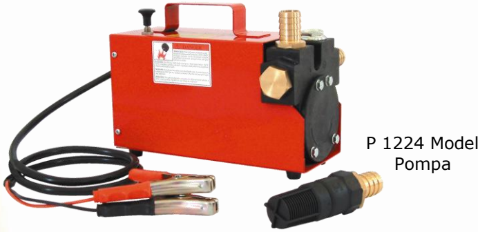
P 1224 Model Pompa