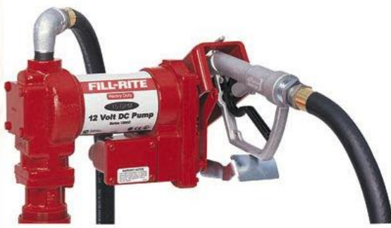
1210 Model Pompa