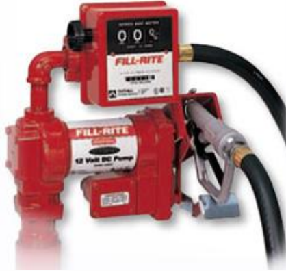
1211 Model Sayaçlı Pompa